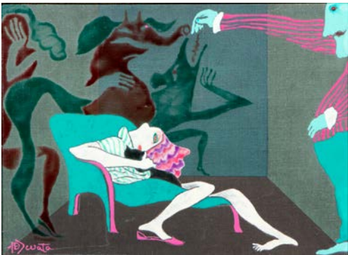
Junzo Wata Sans titre , ND Acrylique et vinyle sur toile fixée sur aggloméré 23 x 32 cm CF 1257 © Bertrand Taoussi