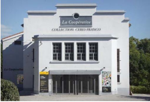
La Coopérative-Collection Cérés Franco vue de la façade, 2016