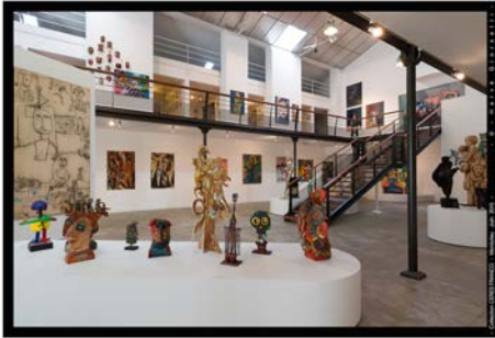
La Coopérative-Collection Cérés Franco vue intérieure, 2016