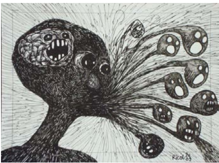
Raphaëlle Ricol Sans titre , 2009 Feutre sur papier 24 x 33 cm CF 1805 © Raphaëlle Ricol