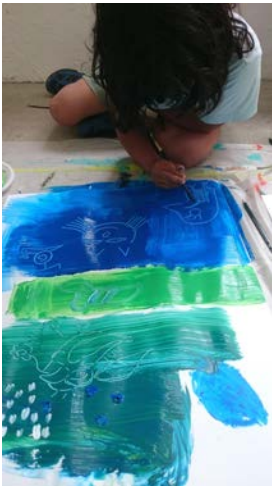
La Coopérative-Collection Cérés Franco vue des ateliers pédagogiques, 2016