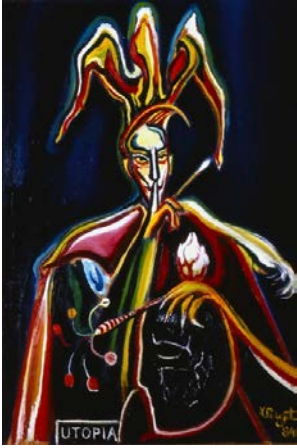
Marcel Pouget Utopia , 1984 Huile sur toile 110 x 72 cm CF 1049