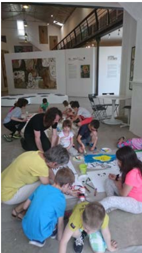
La Coopérative-Collection Cérés Franco vue des ateliers pédagogiques, 2016