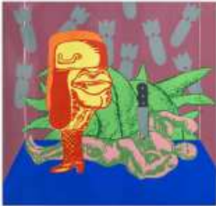
CF 870 Alejandro MARCOS Sans titre, 1971 Sérigraphie sur carton 80 x 80 cm Propriétaire : Collection Cérés Franco