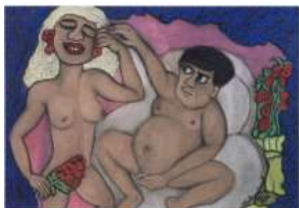
CF 424 Alba Flora CAVALCANTI Motel , 1986 Pastel sur carton 50 x 70 cm Propriétaire : Collection Cérés Franco