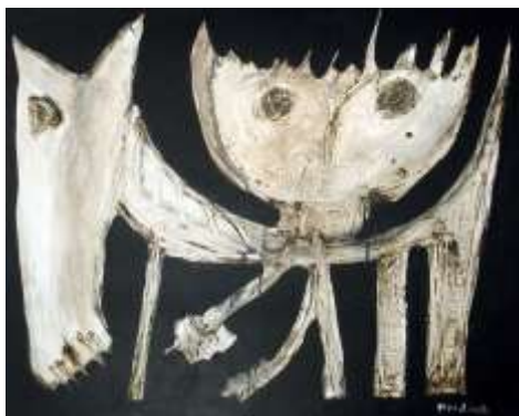
CF 44 Pepe DOÑATE Lady Godiva, 2002 Techniques mixtes sur toile 65 x 81.2 cm Propriétaire : Collection Cérés Franco