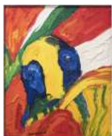
CF 795 Bengt LINDSTROM Inondé de lumière, 1995 Huile sur toile 100 x 81 cm Propriétaire : Collection Cérés Franco