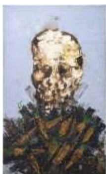
CF 1955 Fred KLEINBERG Vanité aux carottes, 2008 Huile sur toile 162 x 97 cm Propriétaire : Collection Cérès Franco