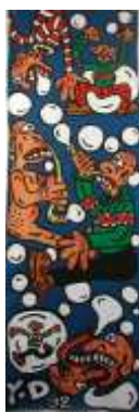
CF 482 Yan DARÇON Sans titre, 1992 Acrylique sur toile 220 x 71.5 cm Propriétaire : Collection Cérés Franco