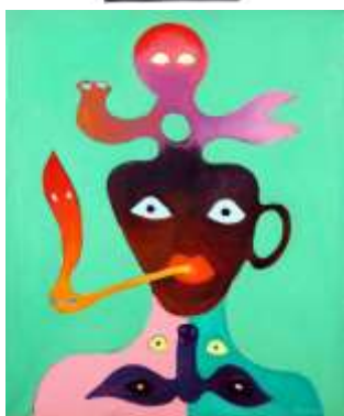
CF 416 James-Jacques BROWN Sans titre , 1974 Acrylique sur toile 55 x 46 cm Propriétaire : Collection Cérés Franco