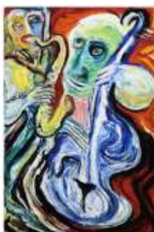
CF 1760 Sylvie BADIA Le saxophoniste, 1989 Huile sur toile 199 x 130 cm Propriétaire : Collection Cérés Franco