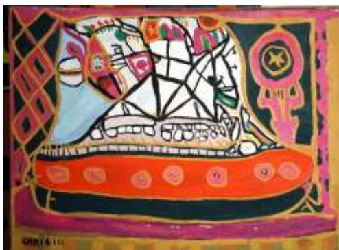
CF 21 CHAÏBIA Sans titre Gouache sur papier marouflé sur bois 57.4 x 76.6 cm Propriétaire : Collection Cérès Franco