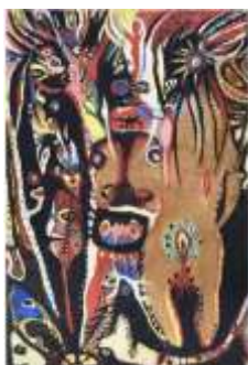
CF 257 Christine SEFOLOSHA Vaudou, 1993 Huile et terre sur toile 150 x 100 cm Propriétaire : Collection Cérés Franco