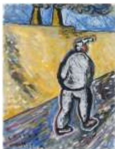
CF 451 Horacio CORDERO Sans titre, 1979 Gouache et pastel sur papier 64.1 x 50 cm Propriétaire : Collection Cérés Franco