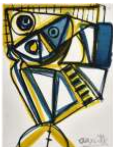
CF 2149 Francis AUXIETTE Sans titre, 1988 Gouache sur papier 65 x 50 cm Propriétaire : Collection Cérès Franco