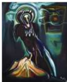
CF 1 042 Marcel POUGET La tentation de Saint Antoine, 1980 Huile sur toile 100 x 83 cm Propriétaire : Collection Cérés Franco