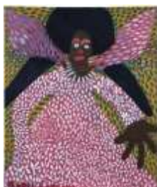
CF 607 Jorélus JOSEPH Sans titre Gouache sur toile 61 x 51 cm Propriétaire : Collection Cérés Franco