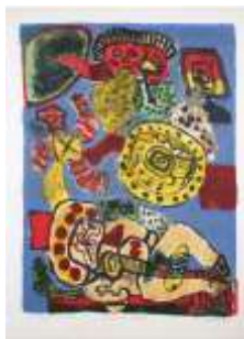
CF 1937 CORNEILLE Printemps tropical, 1966 Lithographie sur papier EA 79 x 59 cm Propriétaire : Collection Cérès Franco