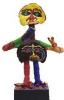
CF 335 Joaquim Baptista ANTUNES Sans titre , 1992 Sculpture en bois peint 63 ( avec socle 92) x 40 x 34 cm Propriétaire : Collection Cérés Franco