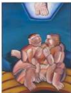
CF 655 Abraham HADAD Les deux et la main, 1974 Huile sur toile 116.1 x 89.3 cm Propriétaire : Collection Cérés Franco