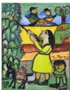
CF 125 JABER Sans titre Gouache sur papier 65 x 50 cm Propriétaire : Collection Cérés Franco