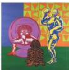
CF 1945 Alejandro MARCOS Sans titre, 1971 Sérigraphie sur papier 12/30 80 x 80 cm Propriétaire : Collection Cérès Franco