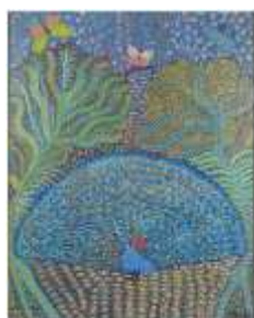
CF 66 GRAUBEN DO MONTE LIMA dit GRAUBEN Sans titre, 1965 Huile sur toile 80.5 x 64.1 cm Propriétaire : Collection Cérés Franco