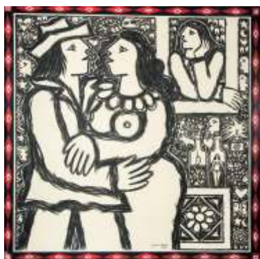
CF 511 Juraci DOREA Sans titre, 1998 Acrylique et craie sur toile 100 x 100 cm Propriétaire : Collection Cérés Franco