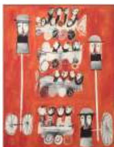
CF 561 Yannis GAÏTIS Sans titre, 1968 Huile sur toile 117 x 90 cm Propriétaire : Collection Cérés Franco