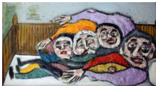
CF 294 Philippe AÏNI Le tas Bourre à matelas et huile sur toile 60 x 107 cm Propriétaire : Collection Cérès Franco