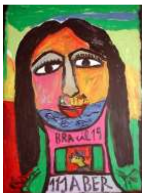
CF 133 JABER Portrait de Cérés Franco Gouache sur toile 100 x 73 cm Propriétaire : Collection Cérés Franco