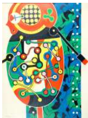
CF 315 Edmund ALLEYN Robo-bonne , 1965 Acrylique sur toile 130 x 96 cm Propriétaire : Collection Cérès Franco