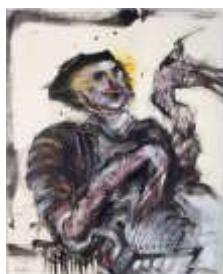
CF 940 Stani NITKOWSKI L'oiseleur, 1991 Huile sur toile 73 x 60 cm Lieu de stockage de départ : La Coopérative - Expo 2020 - étage alcôve 9 Prix assurance : 12 000 Propriétaire : Collection Cérés Franco