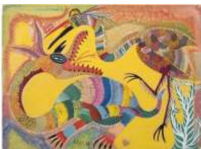
CF 43 Francisco DA SILVA Sans titre, 1966 Gouache sur papier 56 x 76 cm Propriétaire : Collection Cérès Franco