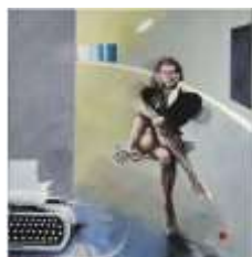
CF 822 Christopher McDEVITT Le Marchand d'art, 1978 Huile sur toile 138 x 133 cm Propriétaire : Collection Cérés Franco