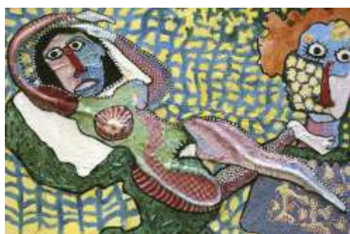
CF 460 Joël CRESPIN Oh ! Putain que les femmes sont belles !, 1997 Techniques mixtes et tissus peints à l'huile 130 x 195 cm Propriétaire : Collection Cérés Franco Crédit photographique : ?