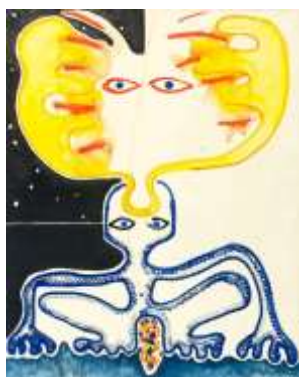
CF 897 R. MASSA Sans titre, 1966 circa Huile sur toile 92 x 73 cm Propriétaire : Collection Cérés Franco