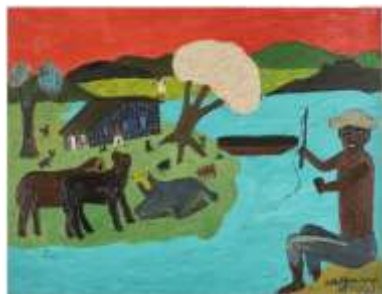
CF 279 WALDOMIRO DE DEUS O pescador , 1972 Acrylique sur toile 50 x 64.5 cm Collection Cérès Franco