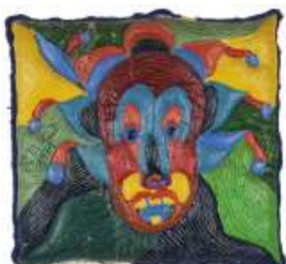
CF 117 Eli Malvina HEIL Sans titre, 1971 Huile et acrylique sur objets détournés 34 x 37 cm Propriétaire : Collection Cérés Franco