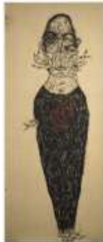
CF 1 Sabhan ADAM Sans titre, 2004 Techniques mixtes sur toile 162 x 67.1 cm Propriétaire : Collection Cérès Franco