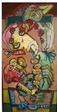
CF 945 Stani NITKOWSKI La grande aumône, 1982 Acrylique sur toile 100 x 49 cm Propriétaire : Collection Cérés Franco