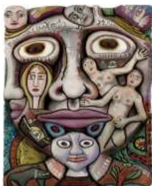
CF 1690 Mario CHICHORRO Rêveur, 1989 Polyester 58 x 47 cm Propriétaire : Collection Cérés Franco